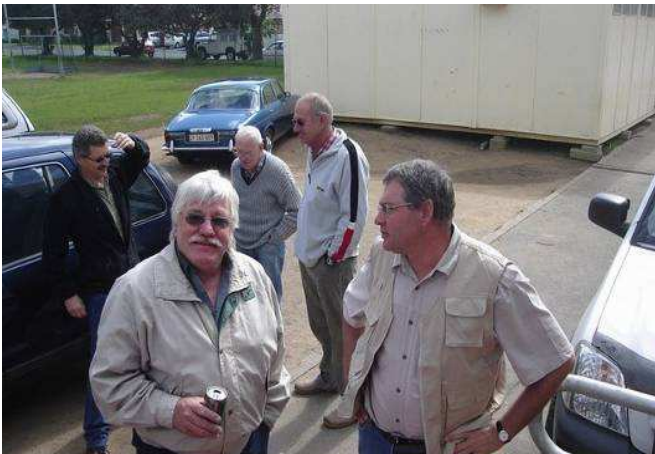
Die manne gesels gedurende die geleentheid.